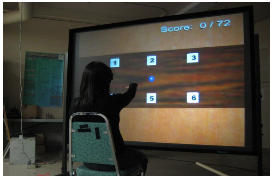
Figure 2. Un exemple d'une application de réalité virtuelle de conception individuelle dans laquelle l'apprenant essaie de pointer du doigt à partir de mouvements rapides et précis vers six cibles différentes. L'apprenant reçoit de l'information à propos de son succès par divers sons et images visuelles ainsi qu'en voyant les résultats indiquant combien de mouvements ont été réussis. Dans cette application, l'enfant est encouragé à répéter l'action plusieurs fois pour consolider l'apprentissage.

Même si ces études ont démontré des résultats positifs dans chacun